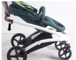
11.3. Надавите на шасси вниз

11.1 Отрегулируйте угол наклона спинки сиденья, разместив ее параллельно ручке 11.2 Сложите раму, нажав большим пальцем на второй замок, а остальными – на кнопку складывания, надавите на ручку до щелчка, оповещающего, что коляска сложилась.