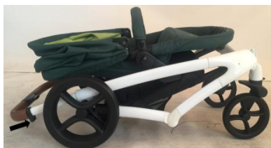
11.4. Шасси сложено