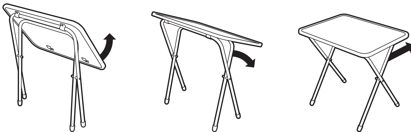
(рис. 2) Схема раскладывания стола

Вы можете оставить отзывы, пожелания и замечания: тел. (3412) 90-99-99, e-mail: otziv@nikaltd.ru