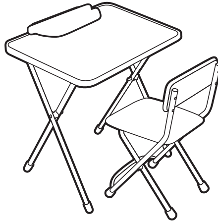
(рис. 1) арт. ТК2/1

Перед эксплуатацией следует ознакомиться с паспортом и руководством по эксплуатации. Следуя инструкции, выполните установку стола и стула.