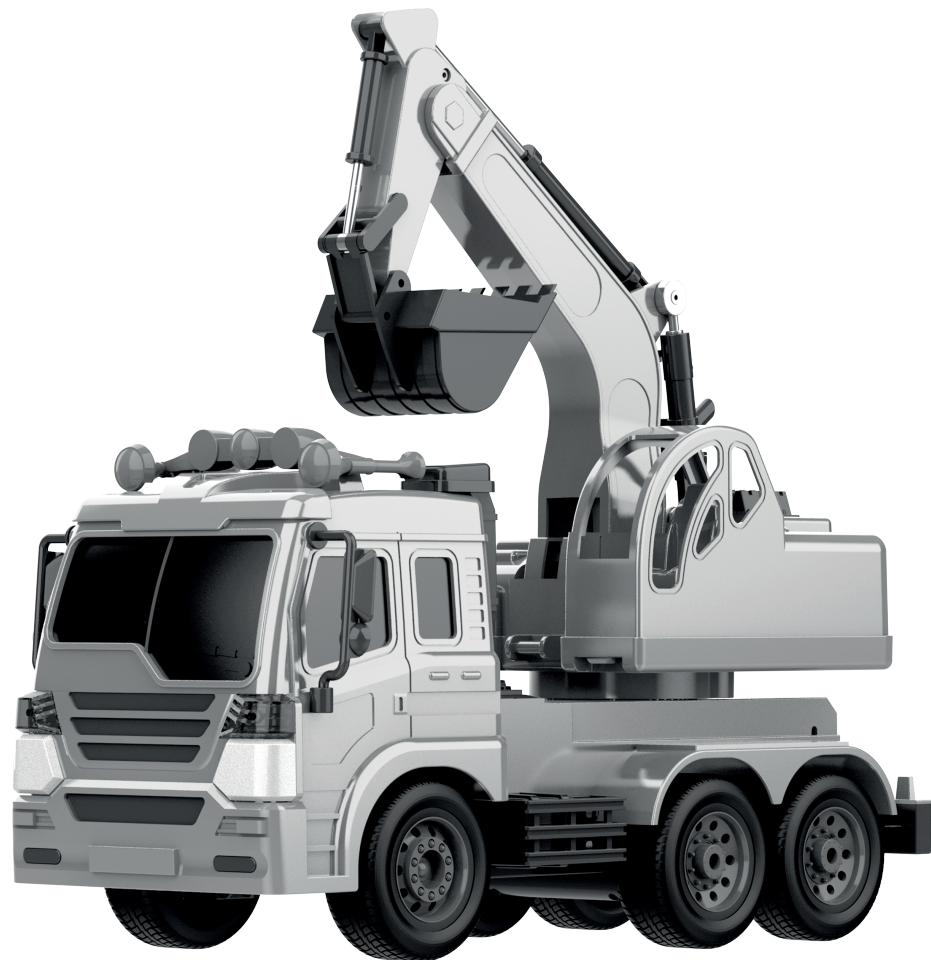
Игрушка для детей старше 6 лет