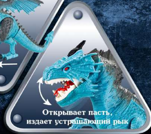
Открывает пасть, издает устрашающий рык