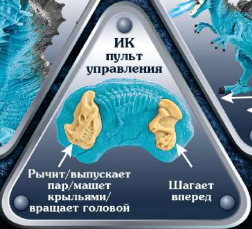
Двигается как настоящий дракон