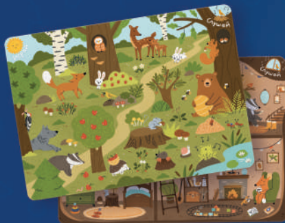
2 МУЗЫКАЛЫҚ- ТАНЫМДЫҚ КАРТА