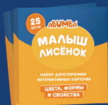
2 КАРТАЛАР ЖИНАҒЫ