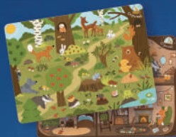
2 музыкально- познавательные карты