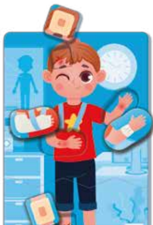
Пазл с фигурными элементами "У доктора"