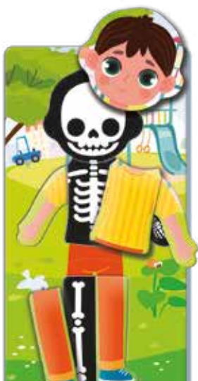
Пазл с фигурными элементами "Скелет человека"