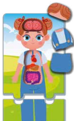
Пазл с фигурными элементами "Внутренние органы"