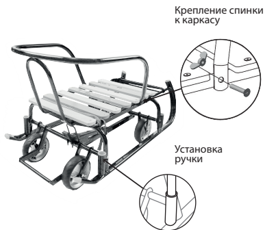
рис. 2 Схема сборки санок