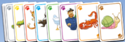
92 vaidinimo kortelės