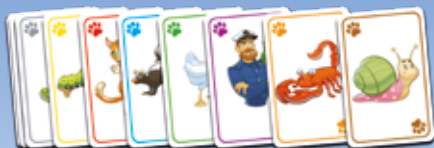
92 darbību kārtis