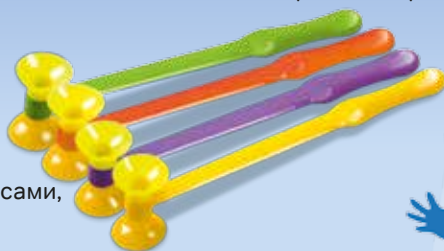
4 лапи з присосами, правила