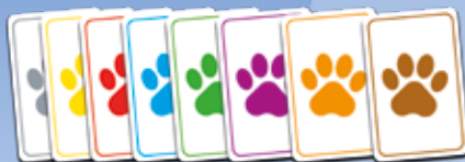
8 loterijas kārtis