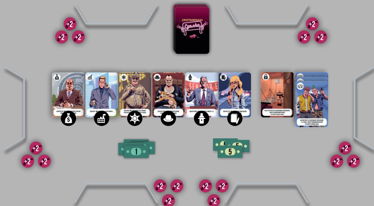
Пример начальной раскладки на 6 игроков