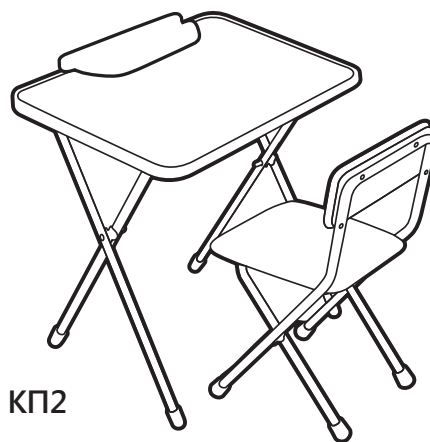
(рис. 2) арт. КП2

Перед эксплуатацией следует ознакомиться с паспортом и руководством по эксплуатации. Следуя инструкции, выполните установку стола и стула.