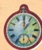
1 знак Первого Игрока круга