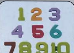
Объемная цифра – 10 шт.