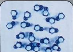
Пингвин – 19 шт.