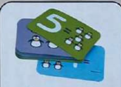
Двухсторонняя карта-задание – 48 шт.