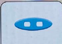
Основа весов – 1 шт.