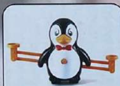
Корпус весов – 1 шт.