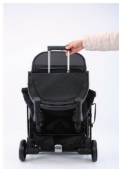
1. Вытащите большую ручку