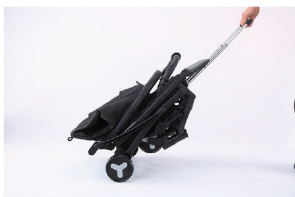
3. Коляска готова к перевозке