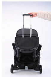
2. Потяните маленькую ручку