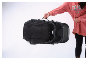
4. Допускается использование боковой ручки для переноса