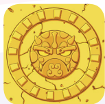
Секретные карточки монстров

Секретные карточки монстров отличаются от карточек монстров оборотом.