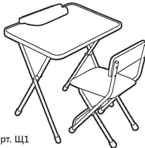
(рис. 2) арт. Щ1

Перед эксплуатацией изделия следует ознакомиться с данным паспортом и руководством по эксплуатации. Следуя инструкции, выполните установку стола и стула.