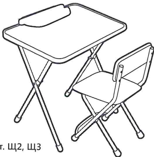
(рис. 1) арт. Щ2, Щ3