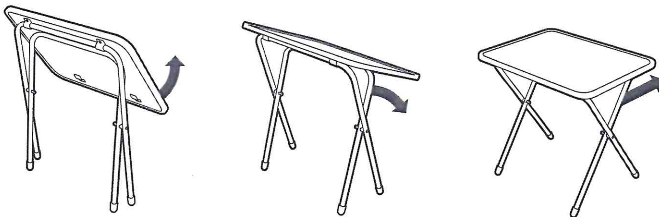
(рис. 3) Схема раскладывания стола

Сведения о документах, подтверждающих соответствие, указаны на сайте изготовителя www.nika-foryou.ru Соответствует требованиям ТР ТС 025/2012 «О безопасности мебельной продукции» ТУ 561812-001-84597115-2014. Модели: СВ, СВМ, СН, СНМ. Сделано в России.