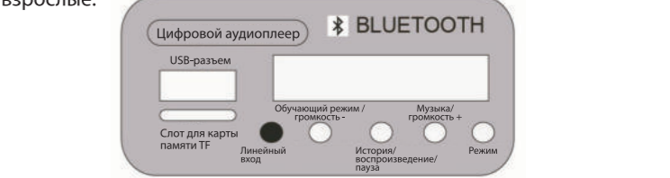
*Линейный вход: MP3-разъем