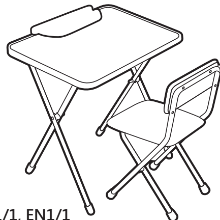
(рис. 1) арт. HW 1/1, EN1/1

Перед эксплуатацией следует ознакомиться с паспортом и руководством по эксплуатации. Следуя инструкции, выполните установку стола и стула.