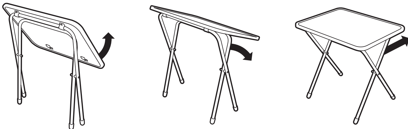
(рис. 3) Схема раскладывания стола

Вы можете оставить отзывы, пожелания и замечания: тел. (3412) 90-99-99, e-mail: otziv@nikaltd.ru