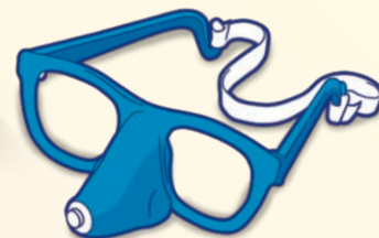
1 Пара очков + держатель