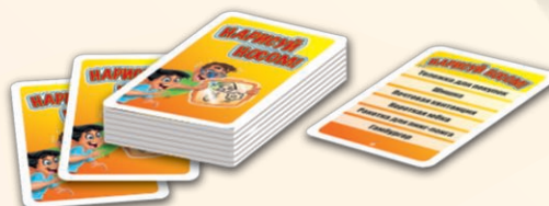
110 карточек с 6 словами (словосочетаниями)