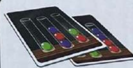
Карта-задание – 54 шт.