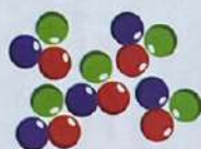
Шарик – 24 шт.