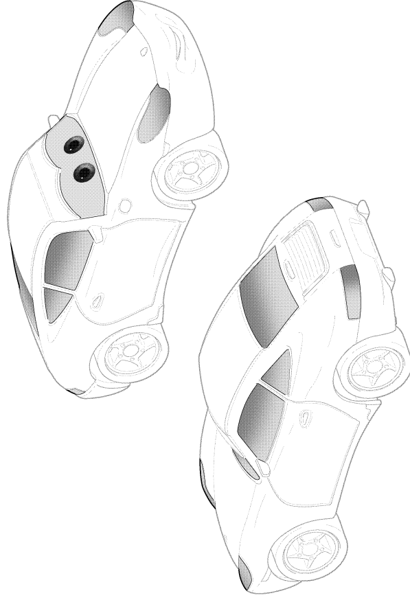
СХЕМА РАЗМЕЩЕНИЯ НАКЛЕЕК НА МОДЕЛИ