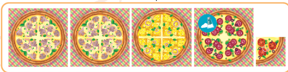
Рис. 5б. Игрок-Б