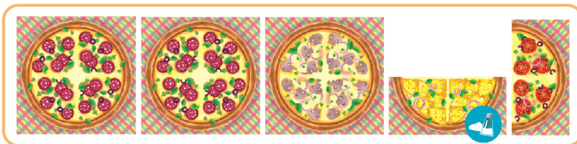
Рис. 5а. Игрок-А