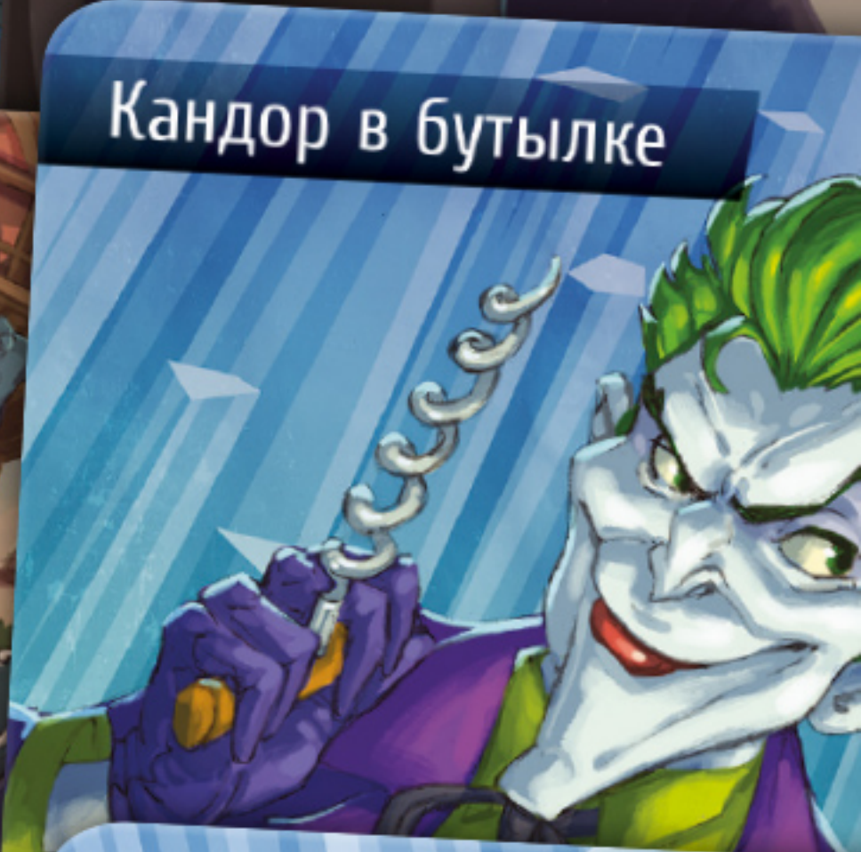
Кандор в бутылке