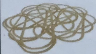
Резинка-снаряд – 250 шт.