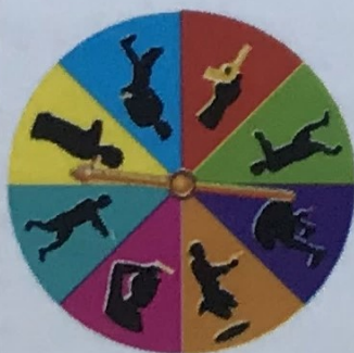
Барабан – 1 шт.