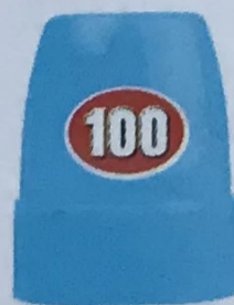
Чашечка – 10 шт.